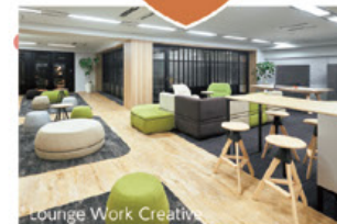
Lounge Work Creative

普段よりも目線が高くなるハイテーブルのミーティングスペースは、気分転換もできて打合せの効率が向上します。