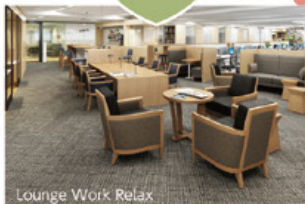
Lounge Work Relax

「知識創造」の促進を旨としたゾーン。立って利用するカウンターテーブルやローテーブル、ラウンジチェアとミニテーブルなど、自由度の高い選択肢を設けました。気分や目標をちょっと変えて仕事をしたいときに活躍します。