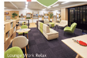
Lounge Work Relax

カジュアルな雰囲気ワークラウンジは、リラックスして話したり考えたりできるため、自由なアイデアが湧きやすくなります。