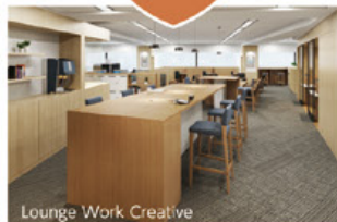
Lounge Work Creative